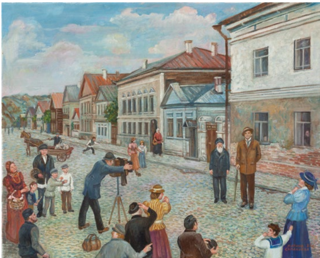
13. Приезд Ф.И. Шаляпина в Казань. В Суконной слободе. 2023 Холст, масло. 40×50. Собственность автора

Родилась 12.11.1958 в Казани. Окончила театрально-декорационное отделение КХУ в 1978 г., Ленинградский государственный институт театра, музыки и кинематографии по специальности «художник театра и кино» в 1983 г. Участвует в республиканских, всероссийских, всесоюзных, международных и зарубежных выставках с 1983 г. Член СХР с 1999 г., член ТСХР с 2012 г. Награждена дипломом РАХ (2014), золотой медалью ТСХР «За вклад в отечественное изобразительное искусство» (2014). Лауреат премии РАХ и Правительства РТ им. Н.И. Фешина (2018).