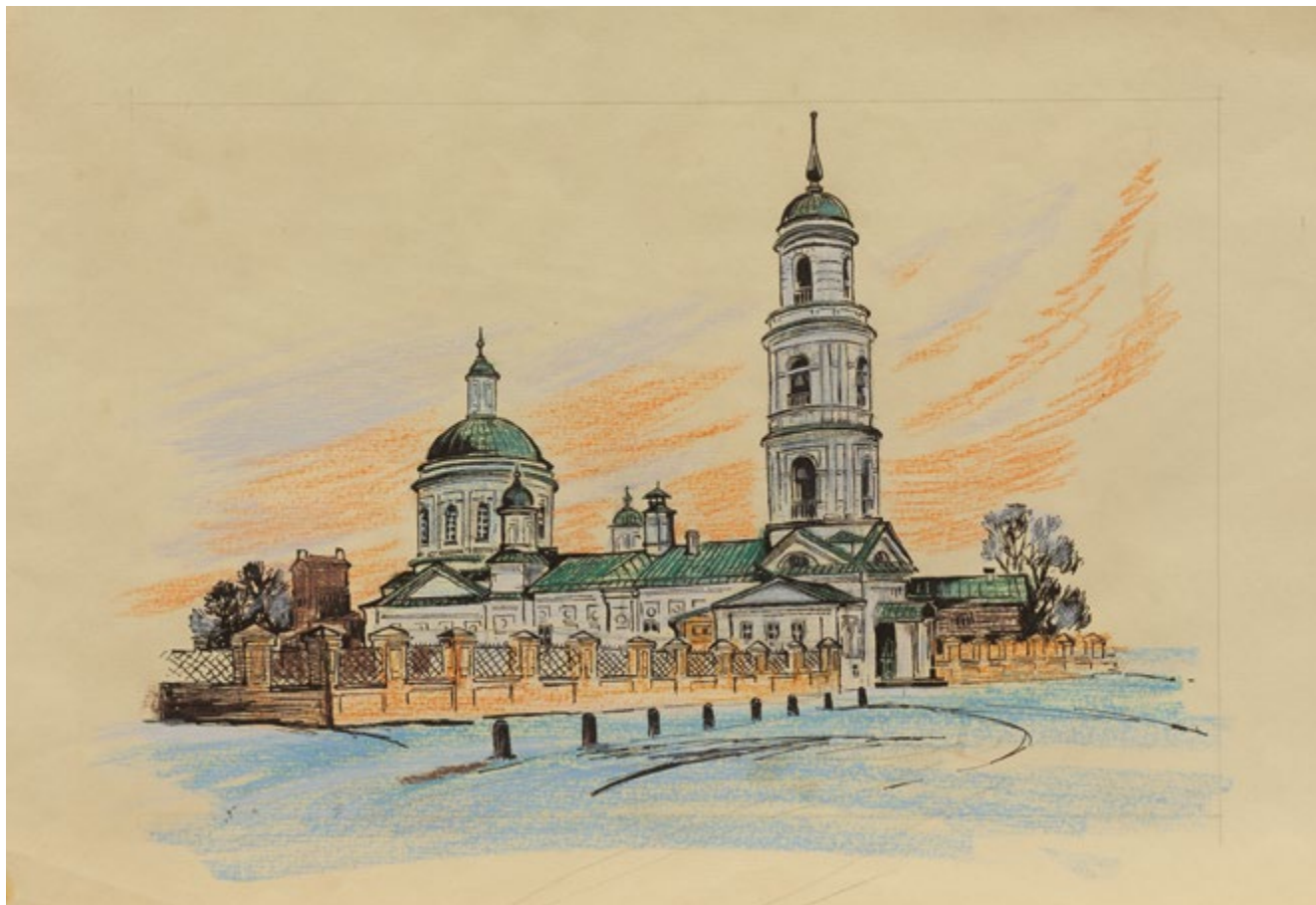
33. Церковь Бориса и Глеба в Плетенях Бумага желтоватая, тушь, перо, пастель. 32×49