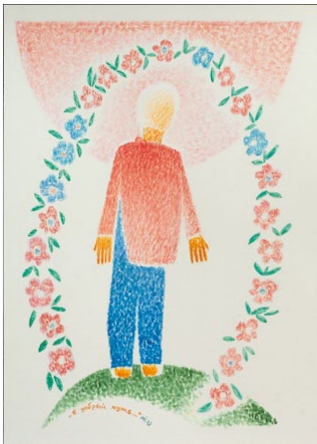
41. В добрый путь... (Центральная часть) Картон, акварель. 70×50