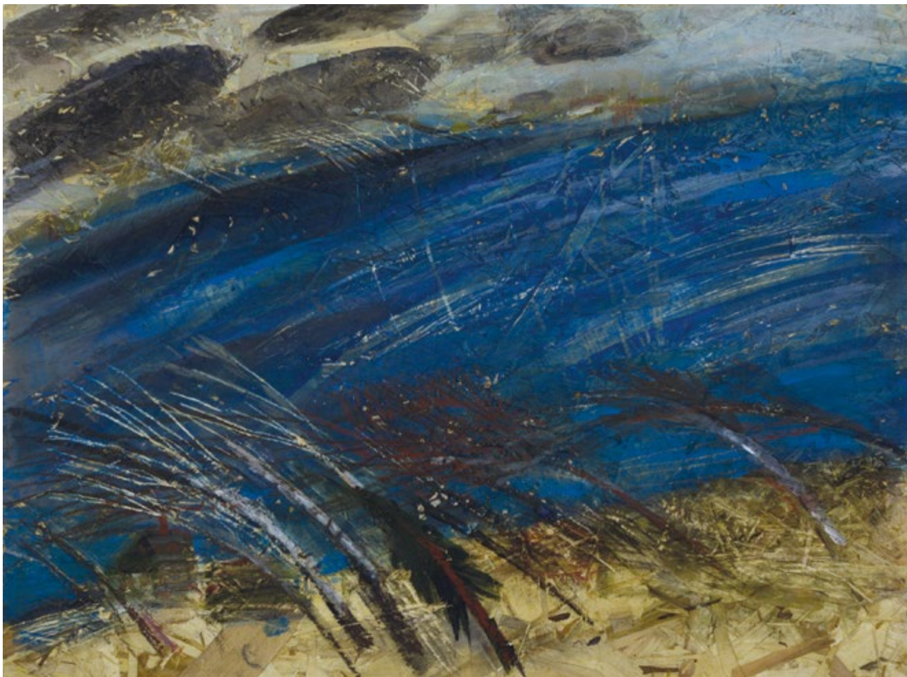
21. Сила голоса Шаляпина (Волга, Казань) ДСП, акрил. 30×40