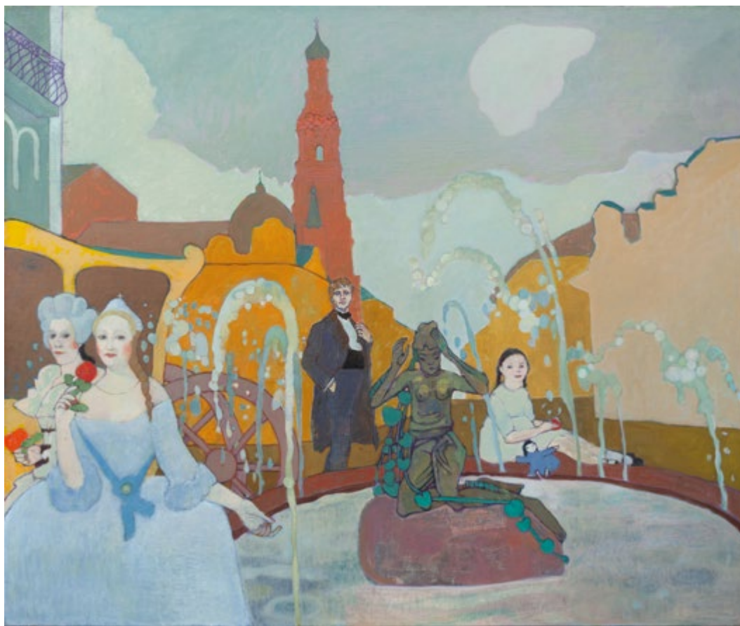
18. Сны улицы Баумана. 2019–2023 Холст, масло. 100×120. Собственность автора

Родился 19.4.1948 в Казани. Окончил МВХПУ в 1975 г. Участвует в республиканских, зональных, региональных, всероссийских, всесоюзных, международных выставках с 1977 г. Член СХ СССР с 1991 г. (СХР с 1991 г.), ТСХР с 2013 г. Награжден нагрудным знаком МК РТ (2011), дипломом РАХ (2012), золотой медалью ТСХР «За вклад в отечественное изобразительное искусство» (2013). Лауреат премии МК РТ им. Баки Урманче в номинации «декоративно-прикладное искусство» (2005), Государственной премии РТ им. Г. Тукая (2022).