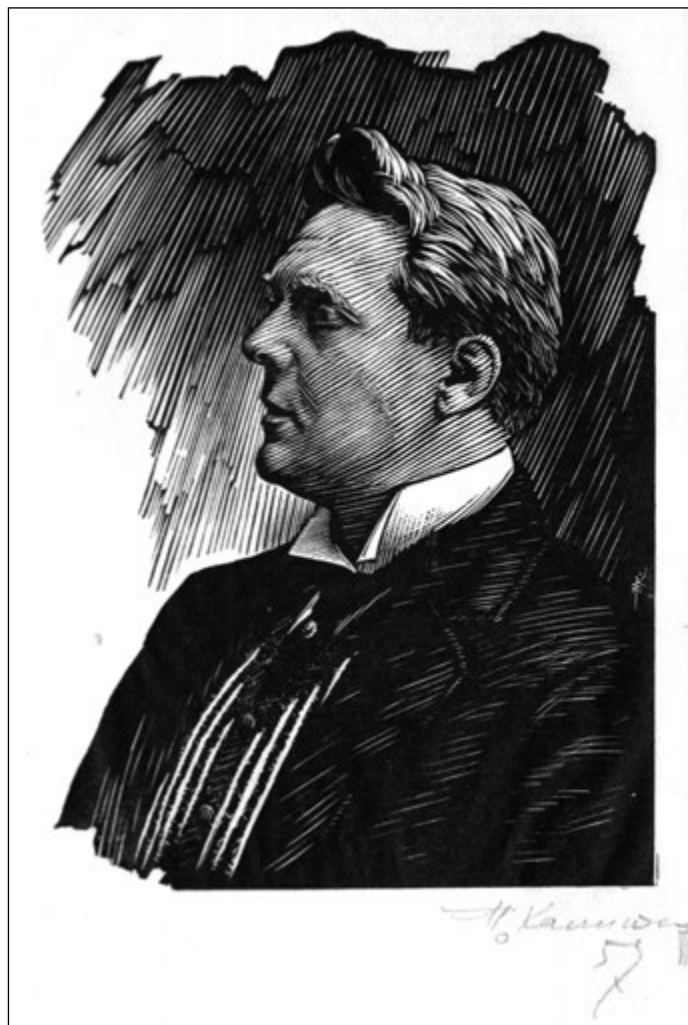
26. Портрет Ф.И. Шаляпина. 1957 Бумага, ксилография. Л.: 13,3×8,3; и.: 8,7×6,2

19.5.1926, Пятигорск – 14.6.2016, Москва. Окончил Московское художественное училище памяти 1905 года в 1947 г., МГХИ им. В.И. Сурикова в 1953 г. Жил и работал в Москве. Член СХ СССР. Участник отечественных и зарубежных выставок с 1953 г. Дипломант VI Всемирного фестиваля молодежи и студентов в Москве (1957), Всесоюзного конкурса «Лучшие книги 1958 г.». Награжден золотой медалью VII Всемирного фестиваля молодежи и студентов в Вене (1959), дипломом 2-й степени Всероссийского конкурса искусства книги (1981) и др.