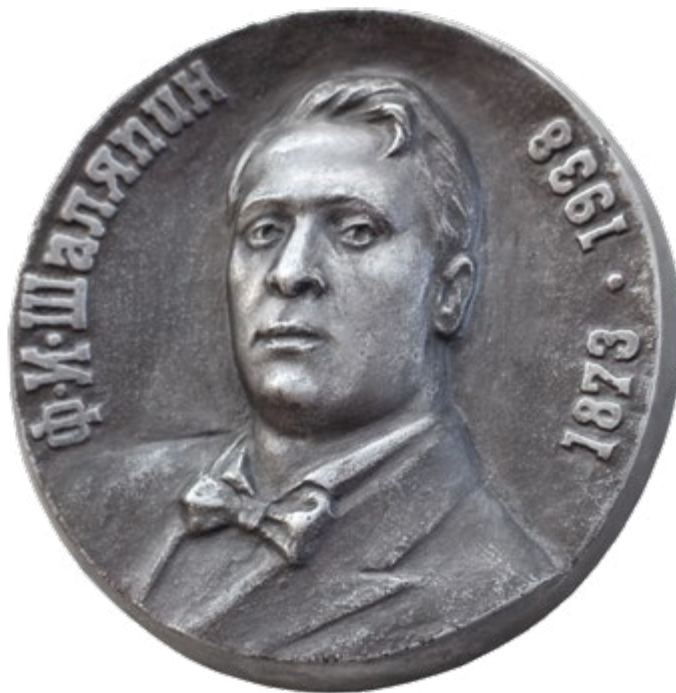
57. Плакетка «Ф. И. Шаляпин». 2020 Силумин, литье. D=16,5 Собственность автора