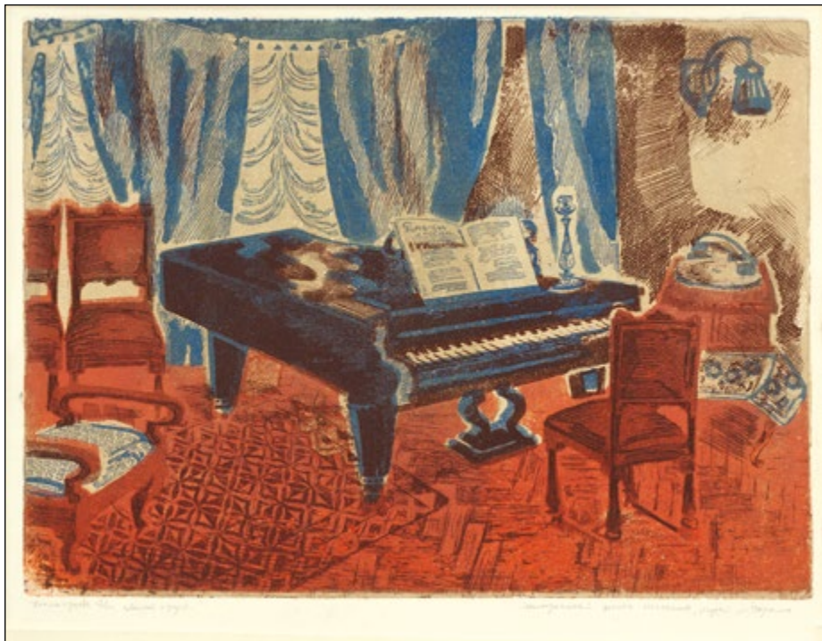
29. Мемориальный уголок Ф.И. Шалапина в Музее М. Горького. 1976 Бумага, цветной офорт. Оттиск: 25×34 Собрание НМ РТ, Музея А.М. Горького и Ф.И. Шалапина

5.7.1930, Свердловск – 7.11.2015, Казань. Окончила Украинский полиграфический институт им. И. Федорова в 1953 г. С 1957 г. жила в Казани. Участвовала в республиканских, зональных, региональных, всероссийских, всесоюзных, международных и зарубежных выставках с 1957 г. Член СХ СССР с 1960 г. (СХР с 1991 г.). Дипломант Всероссийской выставки детской книги и книжной графики (1965), Первого международного конкурса плакатов национальных обществ Красного Креста социалистических стран (1981), Всероссийской выставки плакатов «Волга – боль России» (1990) и др. Награждена Почетной грамотой Президиума Верховного Совета РСФСР (1966), Почетной грамотой Секретариата правления СХ РСФСР (1985), медалью «В память 1000-летия Казани» (2005) и др. Лауреат премии МК РТ им. Б. Урманче в номинации «Графика» (2007), Государственной премии РТ им. Г. Тукая (2015).