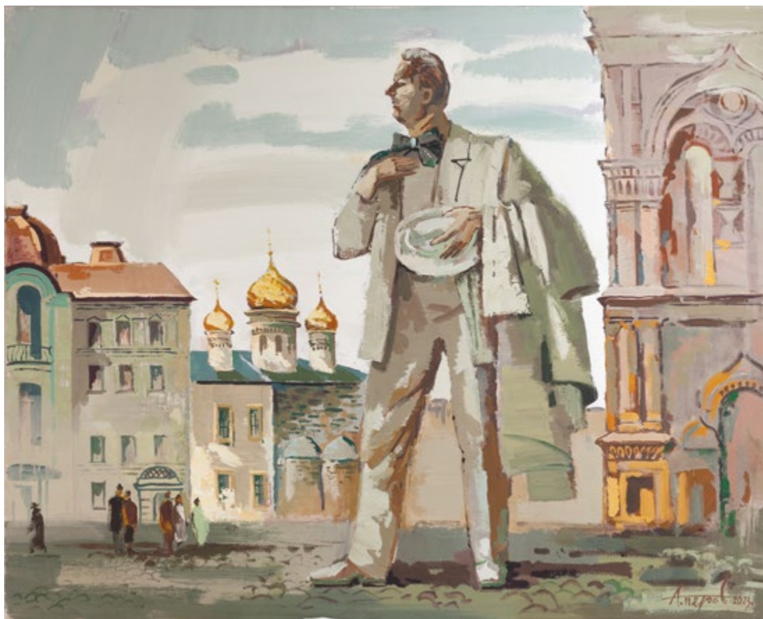
19. Шаляпин в Казани. 2023 Холст, масло. 80×100. Собственность автора

Родился 17.4.1951 в д. Ямаш Альметьевского р-на Татарской АССР. Окончил отделение промышленной графики и рекламы Рязанского художественного училища в 1975 г., отделение художественной обработки металла МВХПУ в 1983 г. Живет и работает в Набережных Челнах с 1983 г. С 1990 г. занимается живописью. Член СХ СССР, СХР и СХТ с 1991 г. Участвует в республиканских, зональных, всероссийских, всесоюзных международных и зарубежных выставках с 1984 г. Неоднократный дипломант СХР в различных номинациях (2006, 2007, 2008, 2016). Награжден медалью «Мастер золотые руки» (2008). Лауреат Премии МК РТ им. Баки Урманче в номинации «живопись» (2016).