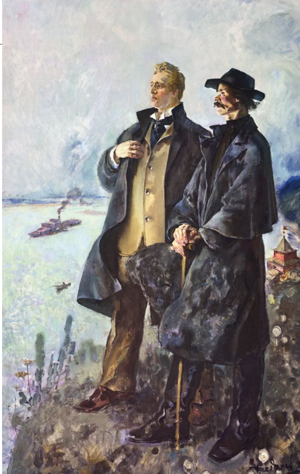
10. М. Горький и Ф. Шаляпин. Год 1901. 1990 Холст, масло. 230×146 Собрание НМ РТ, Музея А.М. Горького и Ф.И. Шаляпина