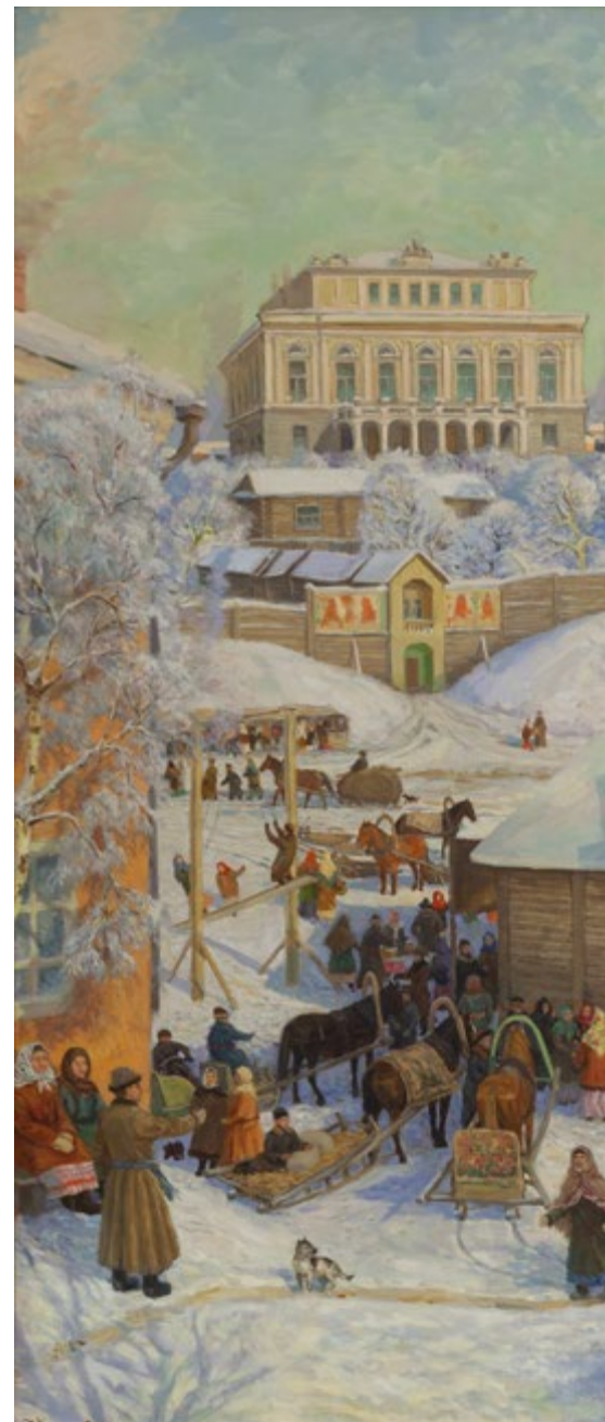
11. Масленица в Казани 1883 г. 1996