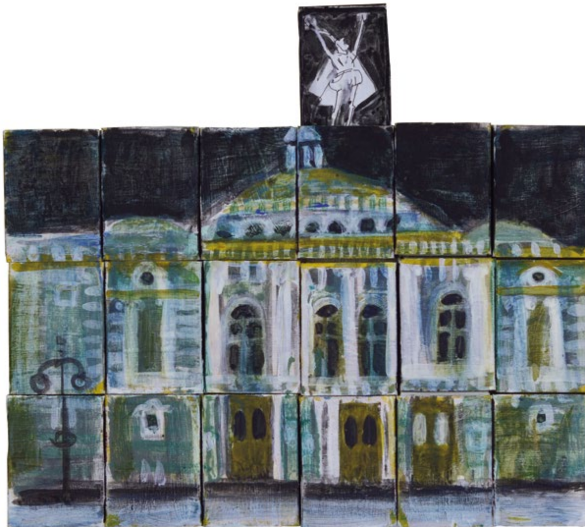
22. Мариинский театр. Премьера оперы Ш. Гуно «Фауст» (Зажигательное искусство Шаляпина). Инсталляция. 2023 Картон (спичечные коробки), акрил. 15×22