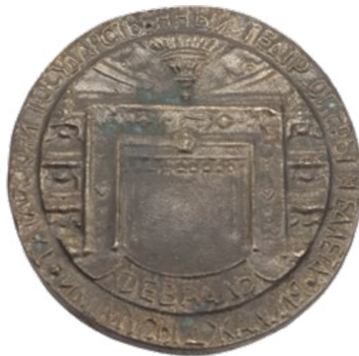
51. Медаль памятная «V Оперный фестиваль им. Ф.И. Шаляпина». 1986 Бронза, литье. D=9,8 Собрание НМ РТ, Музея А.М. Горького и Ф.И. Шаляпина