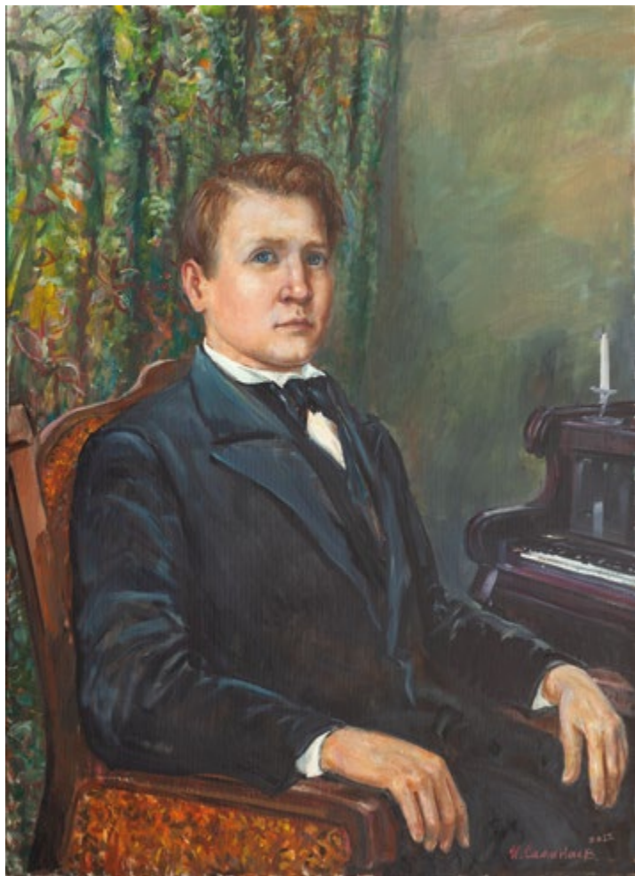
12. Портрет молодого Федора Шаляпина. 2023 Холст, масло. 90×65 Собственность автора

Родился 20.11.1954 в г. Казани. Окончил живописное отделение КХУ в 1974 г., живописное отделение МГХИ им. В.И. Сурикова в 1981 г. Участвует в республиканских, всероссийских, всесоюзных, международных и зарубежных выставках с 1975 г. Член СХ СССР с 1989 г. (СХР с 1991 г.), ТСХР с 2012 г. Председатель регионального отделения ТСХР по РТ с 2012 г. Награжден медалью РАХ «К 150-летию Российской государственности» (2012), золотой медалью ТСХР «За вклад в отечественное изобразительное искусство» (2012), медалью «1150 лет Российской Государственности» (2012), медалью РАХ «Достоинному» (2017) и др. Лауреат премии РАХ им. И.Е. Репина (2014).