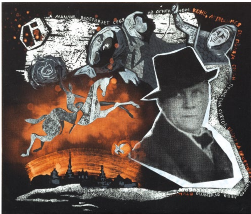
43. А мальчик воображает себя на огненном коне... 2023

Родилась 25.2.1994 в Зеленодольске (РТ). Живет и работает в Волжске (РМЭ). Окончила отделение живописи КХУ им. Н.И. Фешина в 2015 г., отделение графического дизайна КазГИК в 2020 г. Участвует в городских, республиканских, региональных, всероссийских, международных выставках и конкурсах с 2010 г. Член ТСХР с 2015 г. Лауреат молодежной премии «Перспектива» 5-й Казанской международной биеннале печатной графики «Всадник» (2019). Награждена дипломом ТСХР «За вклад в отечественное изобразительное искусство» (2019).