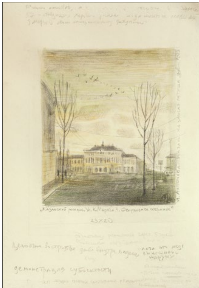
38. Казанская ратуша (бывшее Дворянское собрание) Бумага, графитный карандаш, акварель, цветной карандаш. 41,7×29,6

В этом здании по адресу ул. Жуковского, 4 (быв. Поперечно-Грузинская улица) располагалась Казанская уездная земская управа. 4 года, начиная с 12-ти лет, Федор Шаяпин служил здесь писарем с жалованьем в 10 рублей.