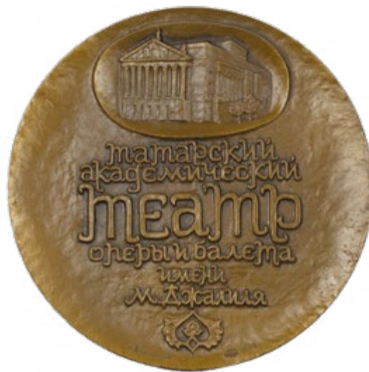
56. Медаль памятная «Оперный фестиваль имени Федора Шаляпина». 1990 Металл, литье. D=6,0 Собрание Музея ТАГТОиБ им. М. Джалиля