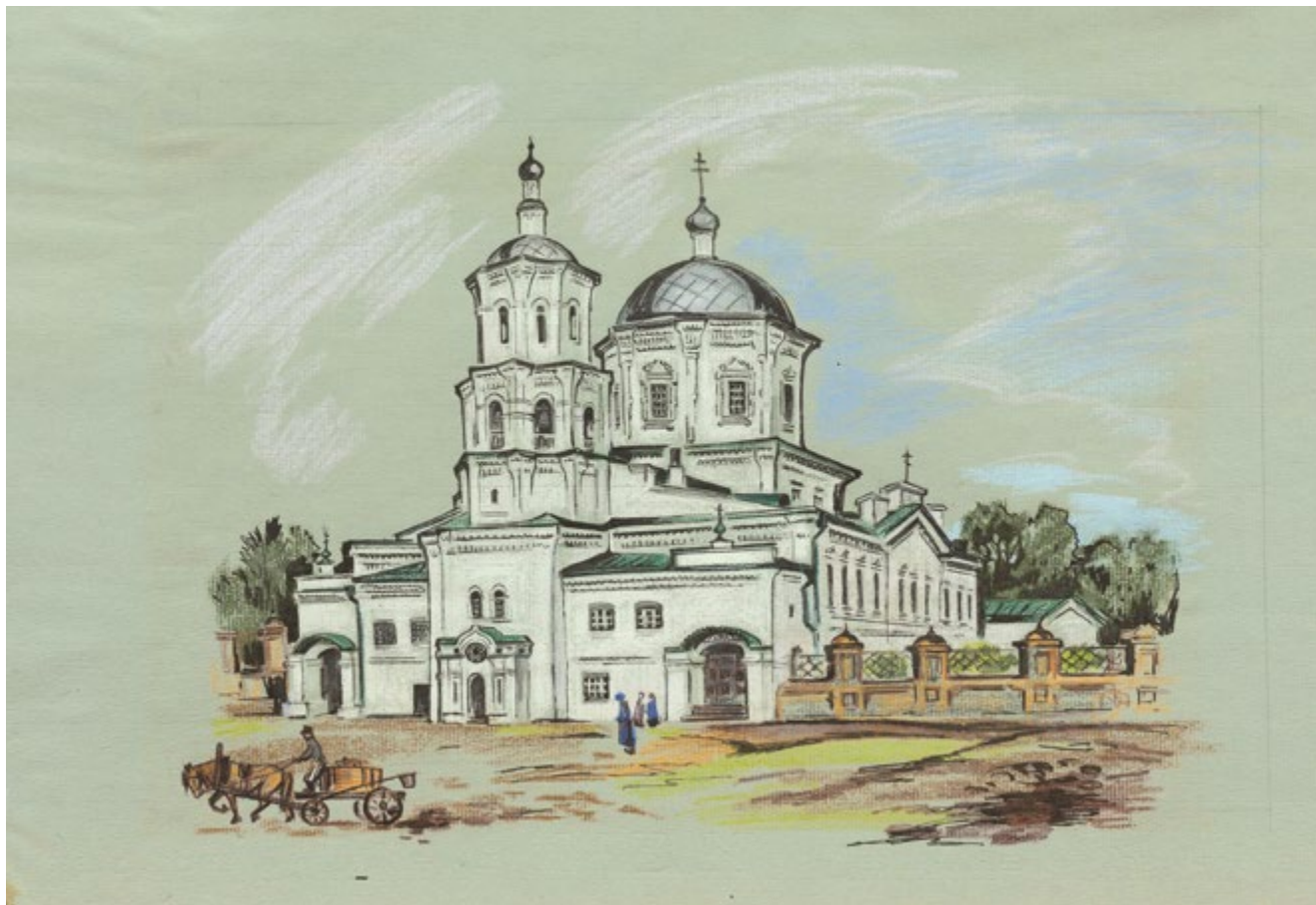
32. Георгиевская церковь Бумага серая, тушь, перо, пастель. 32,5×50