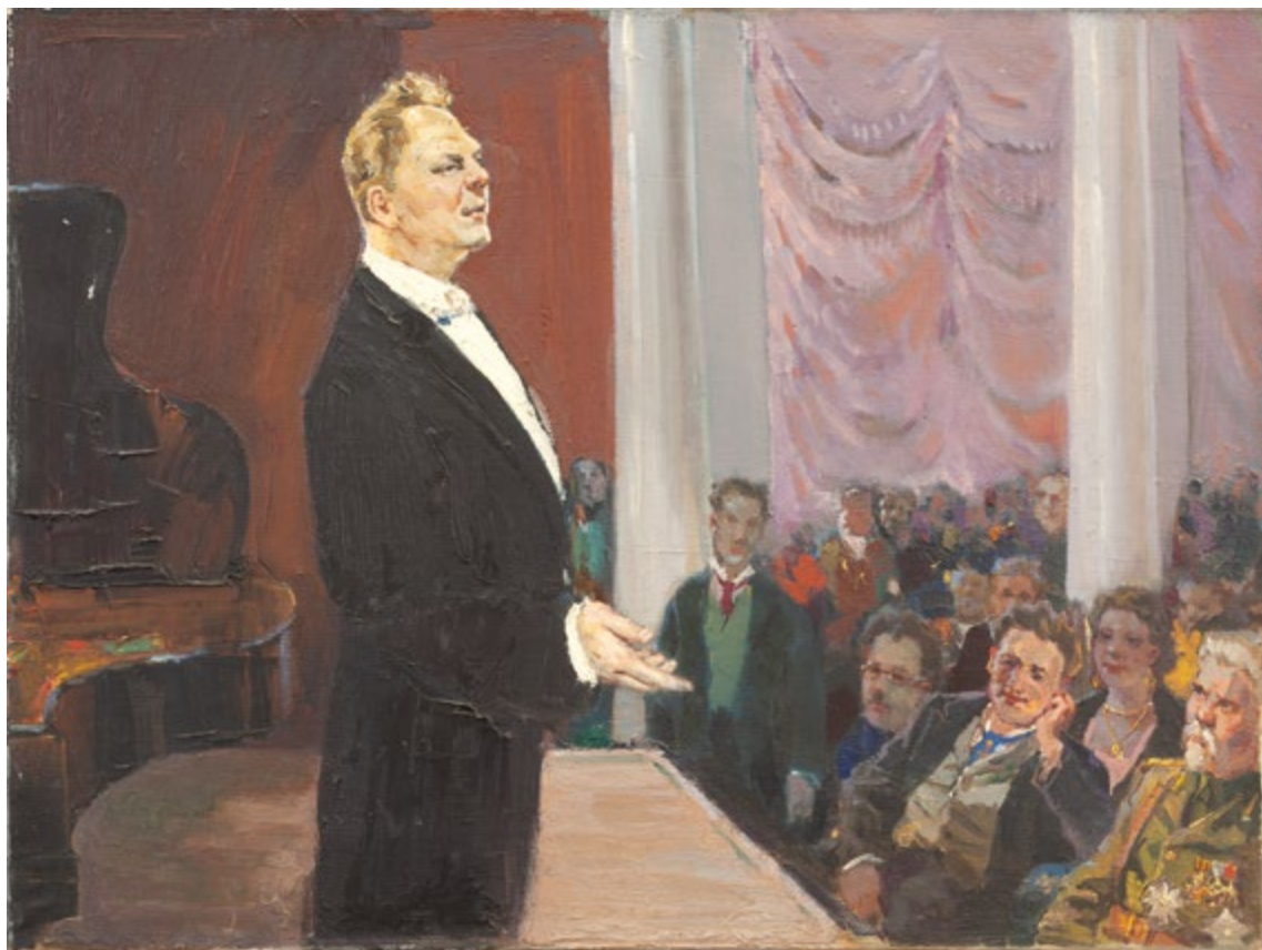
2. Ф.И. Шаляпин на концерте в Дворянском собрании в Казани. 1968 Холст, масло. 59,5×79,5 Собрание НМ РТ, Музея А.М. Горького и Ф.И. Шаляпина

22.2.1918, д. Берёзовка Чистопольского уезда Казанской губ. – 19.02.1995, Казань. Окончил Ташкентское художественное училище в 1938 г. Жил в Казани с 1938 г., работал в «Татхудожнике». Участник Великой Отечественной войны (награжден медалью «За боевые заслуги» (1945), орденами Отечественной войны II и I степеней (1943, 1985)). Работал в ТХФ в 1953–1980 гг. Участник республиканских, зональных, всероссийских выставок с 1942 г. Член СХ СССР с 1960 г. Награжден Почетными грамотами Верховного Совета ТАССР (1957, 1968).