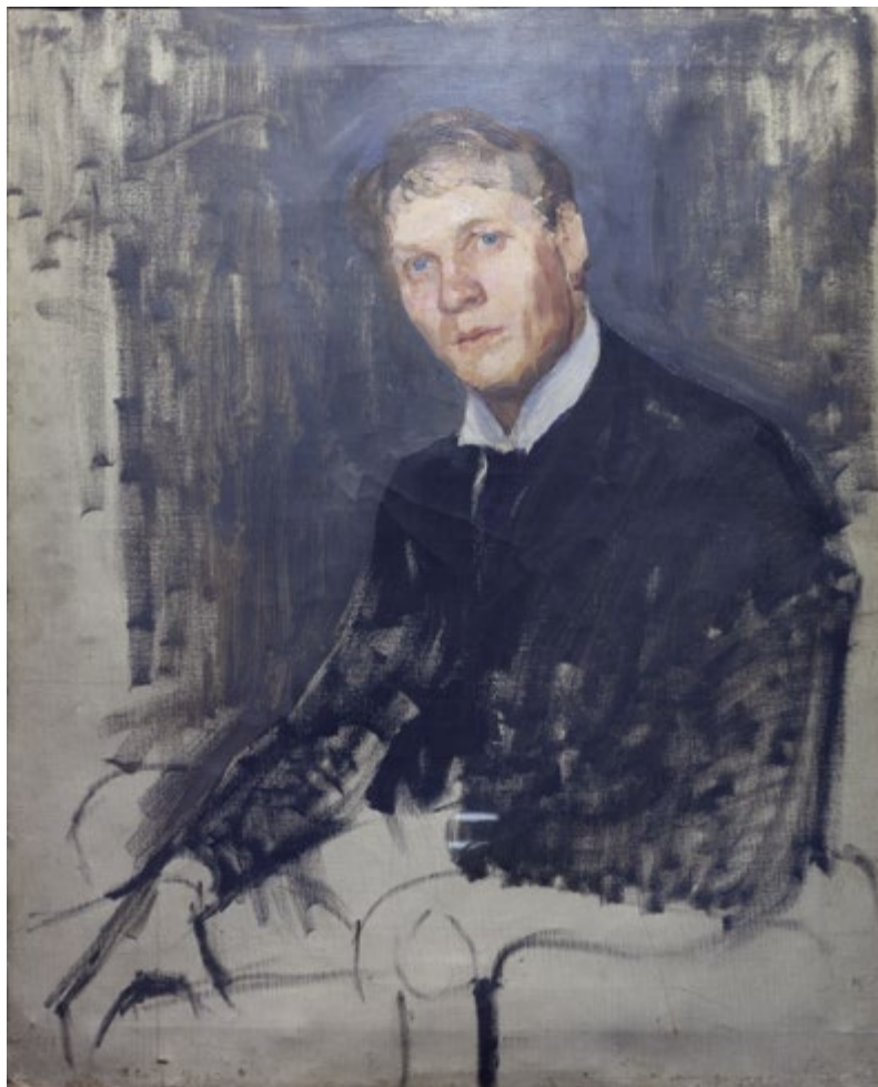
1. Портрет Ф.И. Шаляпина. Неоконченный вариант. 1901 Холст, масло. 88×71 Собрание НМ РТ, Музея А.М. Горького и Ф.И. Шаляпина

26.12.1874 (7.1.1875), Москва – 26.6.1919, Москва. Окончил Московское училище живописи, ваяния и зодчества в 1899 г. Учился у В.Д. Поленова, А.Е. Архипова, Н.А. Касаткина, И.П. Прянишникова, Л.А. Пастернака и др. В 1906–1907 гг. сотрудничал с Московским художественным театром. Член Московского общества любителей художеств с 1909 г. Посещал собрания московского литературного кружка «Среда», создал портреты ряда его членов, в т.ч. Л.Н. Андреева, И.А. Бунина, С.В. Рахманинова, Ф.И. Шаляпина и др. Оконченный вариант портрета Ф.И. Шаляпина хранится в собрании Театрального музея им. А.А. Бахрушина.