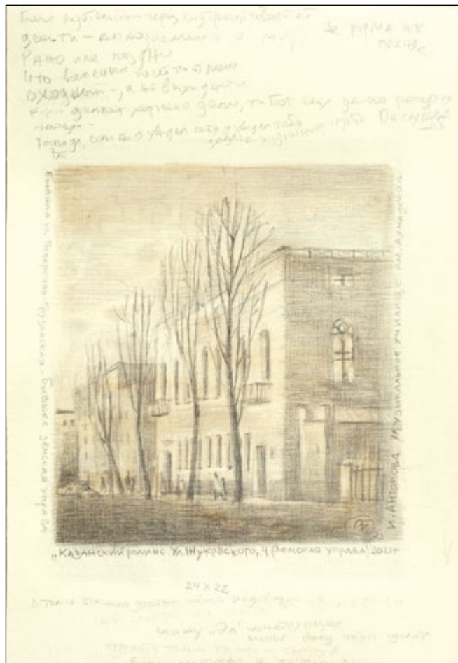
37. Ул. Жуковского, 4, Музыкальное училище (бывшая Земская управа) Бумага, графитный карандаш, цветной карандаш, акварель. 41,7×29,6

В этом здании по адресу ул. Жуковского, 4 (быв. Поперечно-Грузинская улица) располагалась Казанская уездная земская управа. 4 года, начиная с 12-ти лет, Федор Шаяпин служил здесь писарем с жалованьем в 10 рублей.