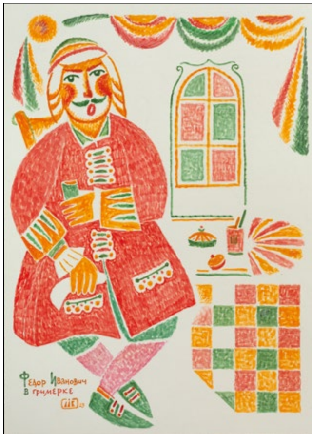
Триптих «Федор Шаляпин». 2023 Собственность автора

Родился 23.8.1946 в д. Ново-Курманаево Татарской АССР. Окончил КХУ в 1970 г., курсы повышения квалификации театральных художников при Московском институте культуры в 1981 г. Участвует в республиканских, региональных, всероссийских, международных выставках с 1976 г. Член СХ СССР с 1984 г. (СХР с 1991 г.). Награжден знаком МК РТ «За достижения в культуре» (2006), серебряной медалью СХР «Духовность. Традиции. Мастерство» (2016), золотой медалью СХР «Духовность, традиции, мастерство» (2018). Лауреат Государственной премии РТ им. Г. Тукая (2018).