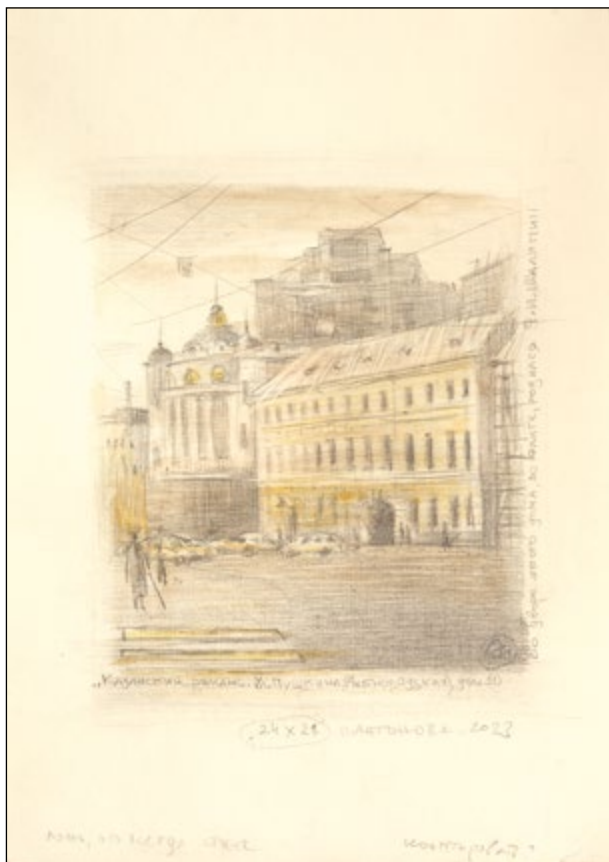
Серия «Казанский романс». 2023 Собственность автора