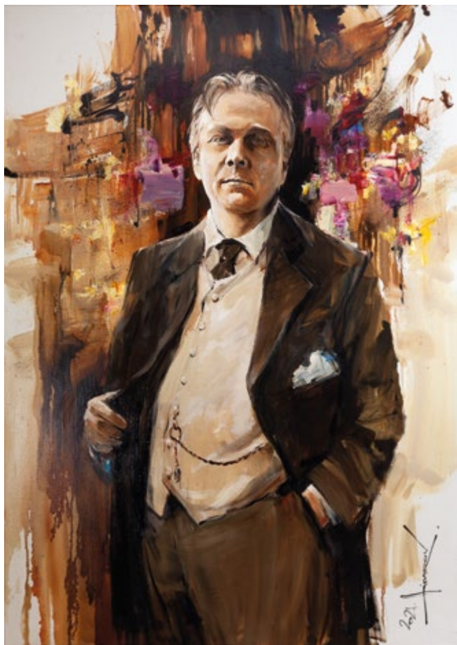
14. Федор Шаляпин. 2021 Холст, масло. 120×85 Собственность автора

Родился 29.1.1956 в г. Казани. Живет и работает в Москве. Окончил Московский архитектурный институт в 1980 г. Участник московских, областных, региональных, республиканских и международных художественных выставок с начала 1980-х гг. Член СХТ с 2004 г., СХР с 2006 г., СХ Москвы с 2006 г. Лауреат Государственной премии РТ им. Г. Тукая (2013). Награжден медалями РТ «В память 1000-летия Казани» (2005) и «За доблестный труд» РТ (2017), серебряной медалью РАХ «Достойному» (2018), орденом РТ «Дуслык» (2020) и др.