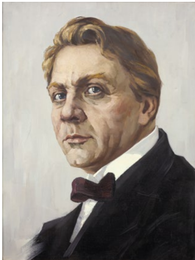
7. Портрет Ф.И. Шаляпина. 1973 Холст, масло. 160×119 Собрание НМ РТ, Музея А.М. Горького и Ф.И. Шаляпина