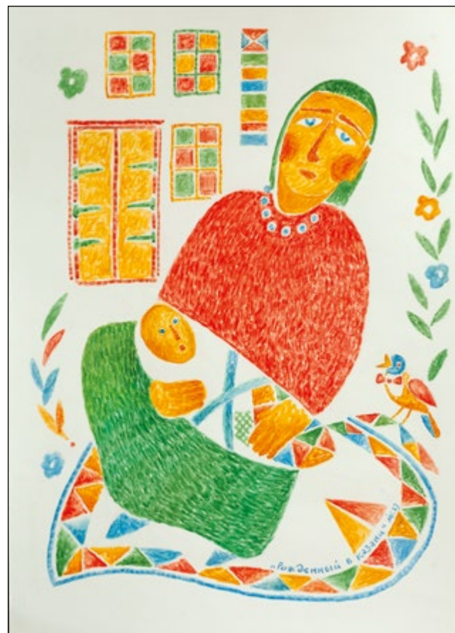
42. Рожденный в Казани. (Правая часть) Картон, акварель. 70×50