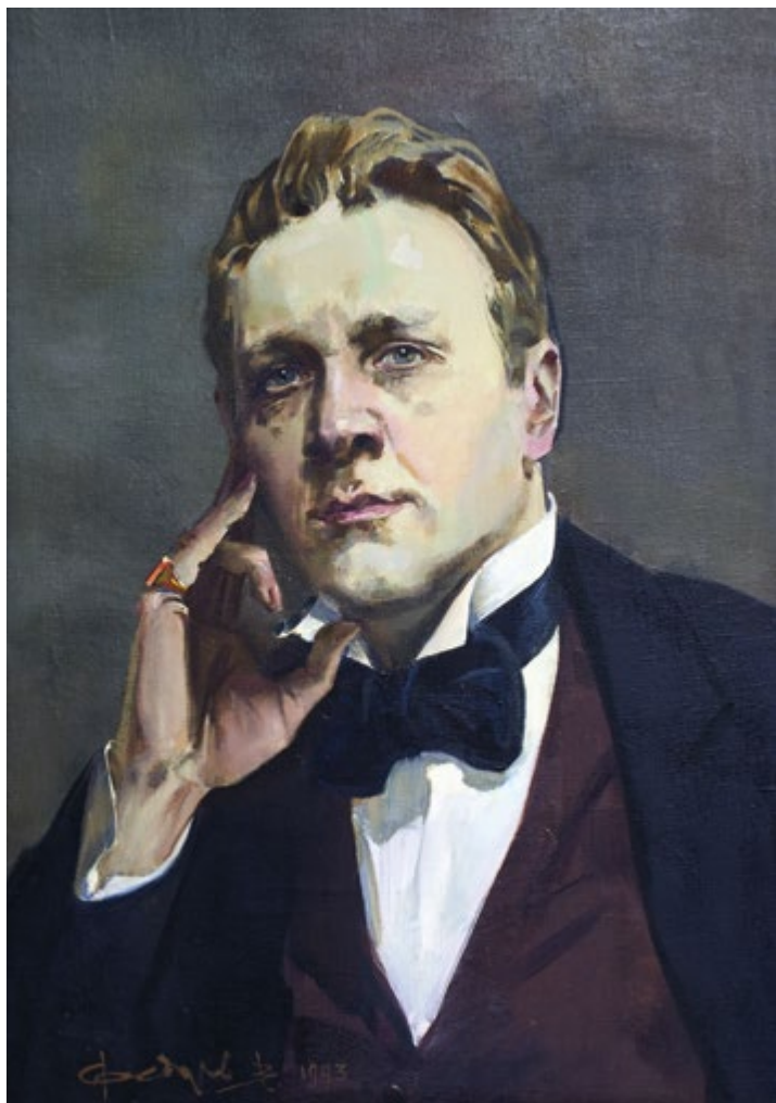
9. Портрет Ф.И. Шаляпина. 1993 Холст, масло. 79×56 Собрание НМ РТ, Музея А.М. Горького и Ф.И. Шаляпина

29.02.1940, Казань – 5.10.2001, Казань. Окончил живописное отделение КХУ в 1959 г., факультет живописи ИЖСА им. И.Е. Репина (по мастерской монументальной живописи под руководством А.А. Мыльникова) в 1966 г. С 1967 г. работал в ТХФ. Участник городских, зональных, республиканских, всероссийских, всесоюзных выставок с 1959 г. Член СХ СССР с 1976 г. (СХР с 1991 г.).