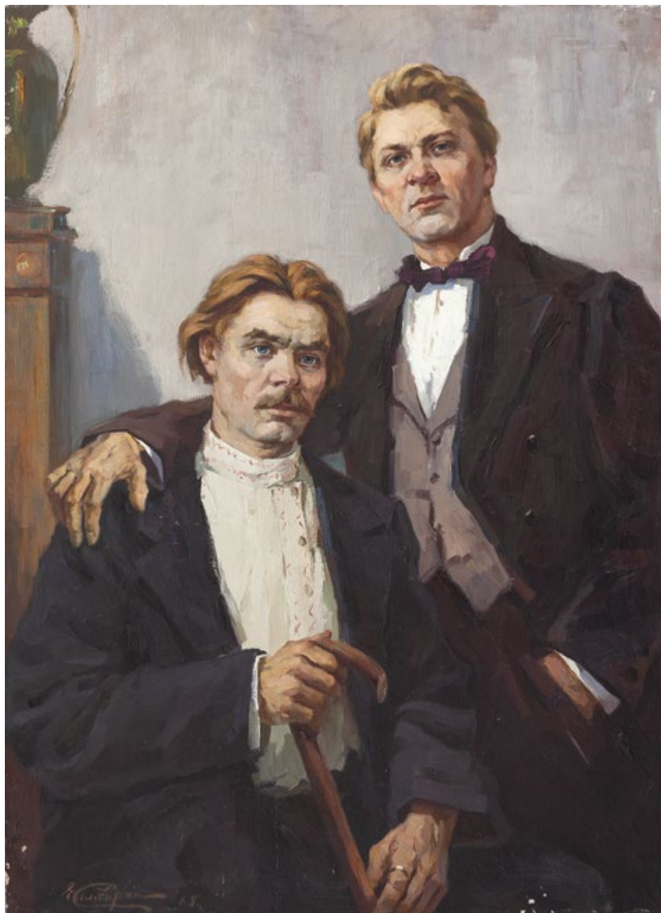
8. Ф. Шаляпин и М. Горький. 1968 Холст, масло. 79,5×59,5 Собрание НМ РТ, Музея А.М. Горького и Ф.И. Шаляпина