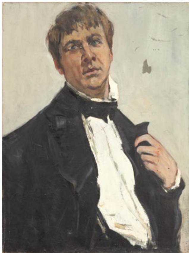
6. Портрет Ф.И. Шаляпина. 1960-е Холст, масло. 79,5×59,5 Собрание НМ РТ, Музея А.М. Горького и Ф.И. Шаляпина

22.11.1923, Казань – 1.7.2000, Казань. Окончил КХУ в 1947 г., учился в 1939–1941, 1945–1947 гг. Участник Великой Отечественной войны (награжден орденом Красной Звезды (1944), медалью «За боевые заслуги» (1944), орденом Отечественной войны I степени (1985)). Работал в «Татхудожнике» с 1947 г., в ТХФ – в 1953–1971, 1975–1983 гг. Участник республиканских, зональных, всероссийских выставок с 1948 г. Член СХ СССР с 1971 г. (СХР с 1991 г.).