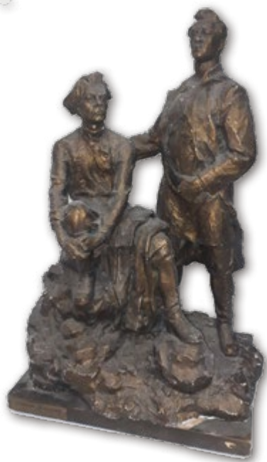
45. Горький и Шаляпин. Вариант. 1959 Гипс, тонирование. 75×45×35 Собрание ГМИИ РТ

1936 – 1979 (?), Казань. Окончил педагогическое (живописное) отделение КХУ в 1957 г. Жил в Казани. Работал в скульптурной мастерской ТХФ. Участник республиканских выставок с 1960 г.