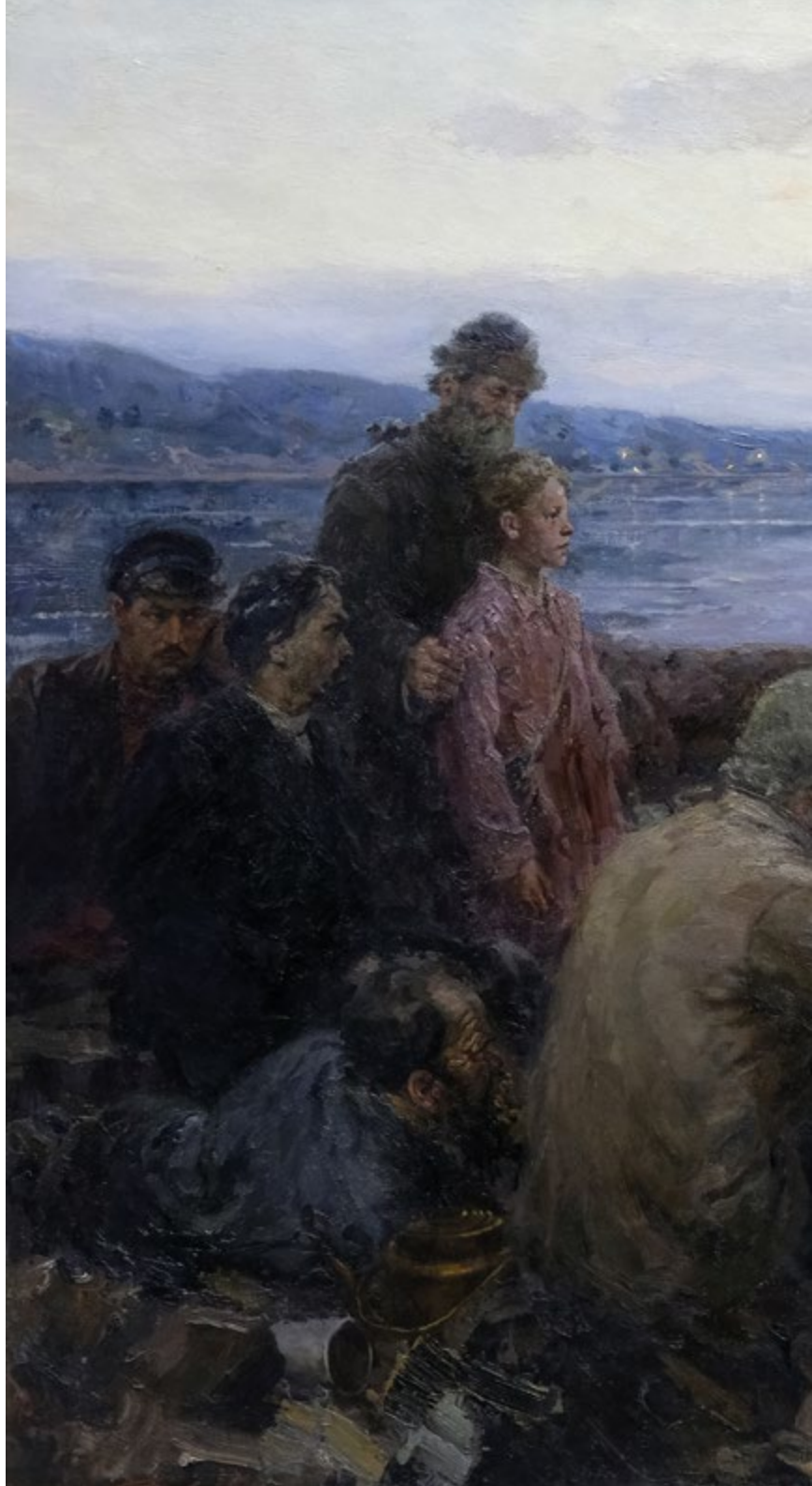
З. Ф.И. Шаляпин. 1956-1957 Холст, масло. 114×176 Собрание ГМИИ РТ