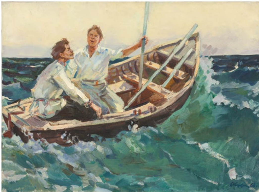
4. М. Горький и Ф. Шаляпин на Черном море. 1968

9.1.1911, г. Алатырь Симбирской губ. – 14.6.1995, Казань. Окончил Чебоксарское художественное училище в 1938 г. Учился в Москве на курсах повышения квалификации художников при Институте изобразительных искусств под руководством В.А. Бакшеева в 1938–1940 гг. С 1940 г. жил в Казани. Участник Великой Отечественной войны (награжден орденом Красной Звезды (1945), орденом Отечественной войны II степени (1985)). Преподавал в КХУ в 1946–1975 гг. Участник республиканских, региональных, всероссийских, всесоюзных, международных выставок с 1942 г. Член СХ СССР с 1940 г. (СХР с 1991 г.). Награжден Почетной грамотой Татарского обкома КПСС и Совета министров ТАССР (1981). Лауреат Государственной премии им. Г. Тукая (1986).