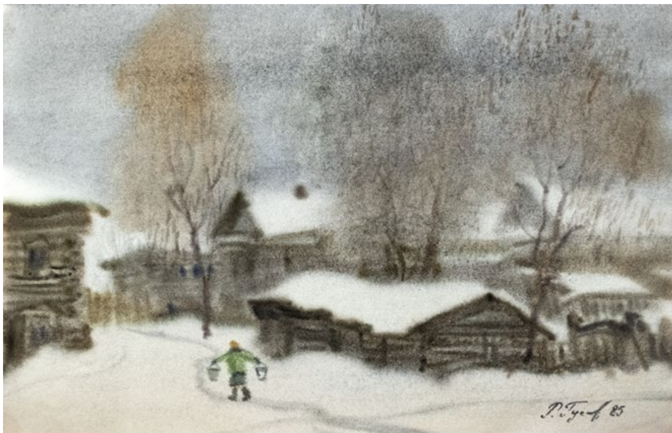
28. Суконная слобода. Из серии «Шляпинские места в Казани». 1985 Бумага, акварель. 32,3×50 Собрание ГМИИ РТ

4.8.1937, Казань – 17.9.2022, Казань. Учился в КХУ в 1952–1956 гг., перевелся в Чебоксарское художественное училище, которое окончил в 1958 г. Жил в Казани с 1966 г. Участвовал в республиканских, региональных, всероссийских, международных и зарубежных выставках с 1970 г. Член СХ СССР с 1976 г. (СХР с 1991 г.), СХТ с 2014 г.