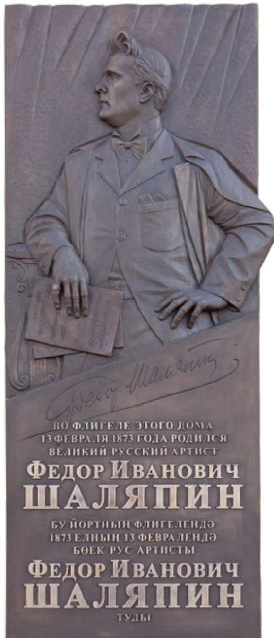
59. Мемориальная доска Ф.И. Шаляпина. 2023 Бронза, литье. 170×70×10

Установлена 13 февраля 2023 г. в Казани, ул. Пушкина, 10.