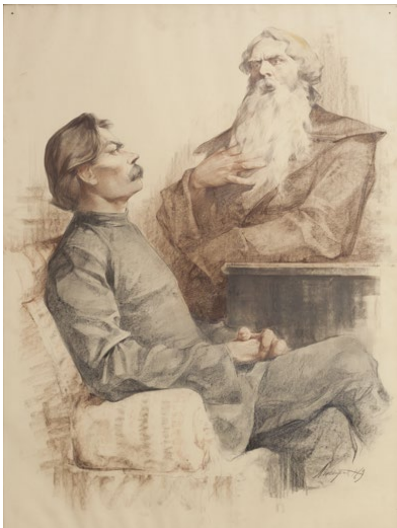
25. Первая встреча М. Горького и Ф. Шаляпина. 1968 Бумага, уголь, сангина. 95×70 Собрание НМ РТ, Музея А.М. Горького и Ф.И. Шаляпина

14.9.1930, Казань – 5.8.1988, Казань. Окончил КХУ в 1954 г., графический факультет Государственного художественного института Эстонской ССР в 1960 г. Участвовал в республиканских, зональных, всероссийских, всесоюзных, международных выставках с 1958 г. Член СХ СССР с 1970 г. Дипломант Всероссийского конкурса искусства книги (Москва, 1967), Всесоюзного конкурса искусства книги (Москва, 1977) и др.