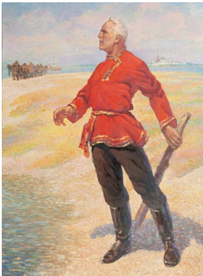
17. Федор Шаляпин снова в Казани. 2023 Оргалит, масло. 102×76 Собственность автора

Родился 28.9.1953 в г. Полоцк Белорусской ССР. Окончил факультет архитектуры ИЖСА им. И.Е. Репина в Ленинграде в 1977 г. Живет в Казани с 1989 г. Участвует в республиканских, зональных, всероссийских, всесоюзных, международных и зарубежных выставках с 1990 г. Член СХР с 1995 г., ТСХР с 2012 г. Награжден Почетной грамотой МК РТ (2013), Бронзовой (2014), Серебряной (2015) и Золотой (2019) медалями ТСХР «За вклад в отечественное изобразительное искусство». Лауреат Премии РАХ и Правительства РТ им. Н.И. Фешина (2016).