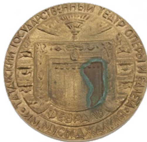
52. Медаль памятная «VI Оперный фестиваль им. Ф.И. Шаляпина». 1987 Бронза, литье. D=9,7 Собрание Музея ТАГТОиБ им. М. Джалиля