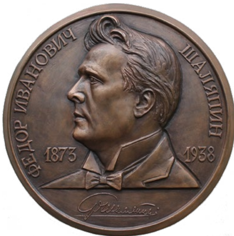
58. Плакетка «Ф.И. Шаляпин». 2023 Медь, гальванопластика. D=20,0 Собственность автора

Родился 2.11.1993 в с. Верхний Услон Верхнеуслонского р-на РТ. Обучался в филиале МГАХИ им. В.И. Сурикова в Казани в 2011 – 2014 гг., затем перевелся в МГАХИ им. В.И. Сурикова в Москве, которое окончил в 2017 г. Живет и работает в с. Верхний Услон. Участвует в городских, зональных, всероссийских и международных выставках с 2012 г. Член СХР с 2019 г. Награжден Почетной грамотой Министерства культуры РТ (2020), Дипломом СХР (2021), Благодарственным письмом Министерства культуры Республики Беларусь (2022).